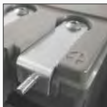
Opcija B: M6 muški prednji adapter terminala