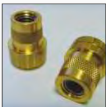
Opcija A: SAE post