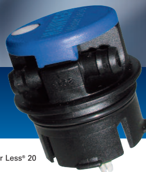
Пробка Water Less® 20

Увеличенное время эксплуатации батареи – Более продолжительные периоды между доливами воды